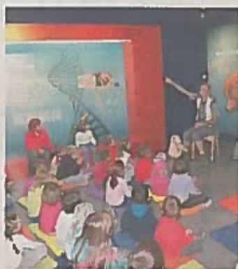
• Libri per bimbi a San Cassiano

Info: tel. 0474 524020, www.museumladin.it.